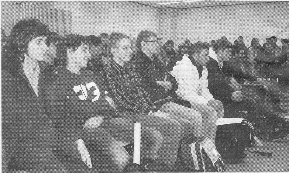
Die Schüler der Otto-Hahn-Schule waren schnell vom komplexen Thema Entwicklungspolitik begeistert.